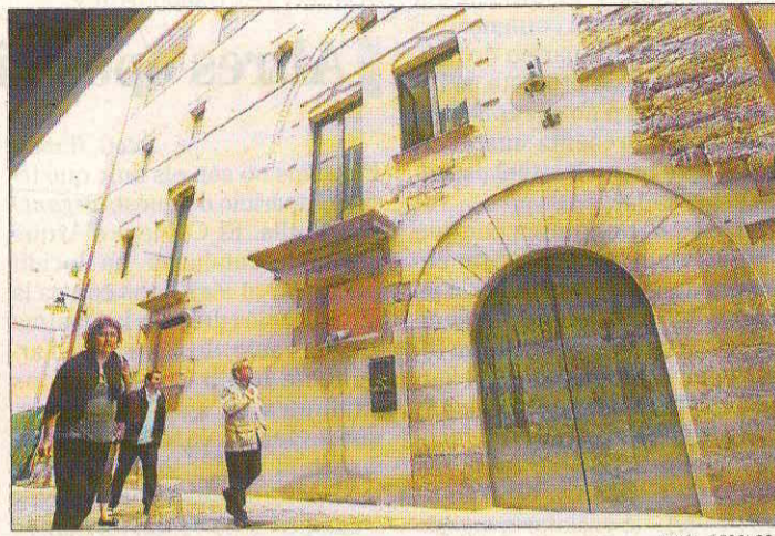
PORTAL DE LA BARCA. El primer hotel obrirà aquest estiu.

L'arribada d'aquesta xarxa d'hotels ha estat anunciada de diferents maneres, sempre amb el rerefons de les llegendes. La fundació va editar fa un any el llibre 42 històries màgiques. Llegendes de Girona , del qual n'és