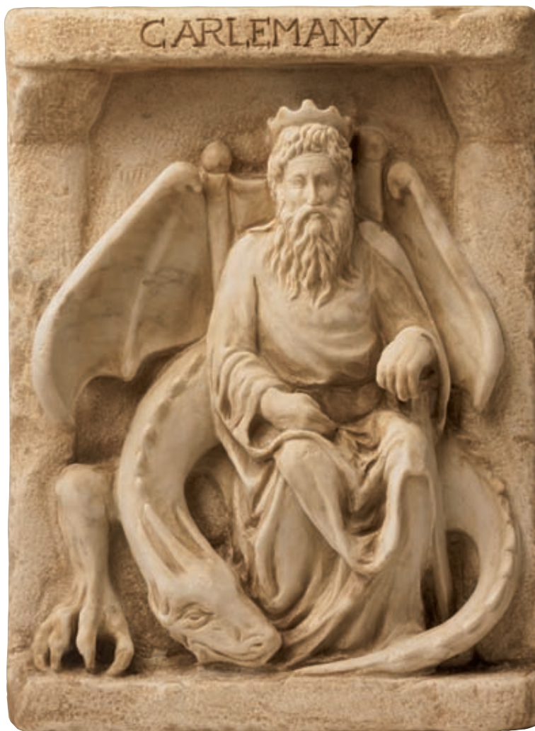
Anno 785, liberazione dai musulmani, Girona.