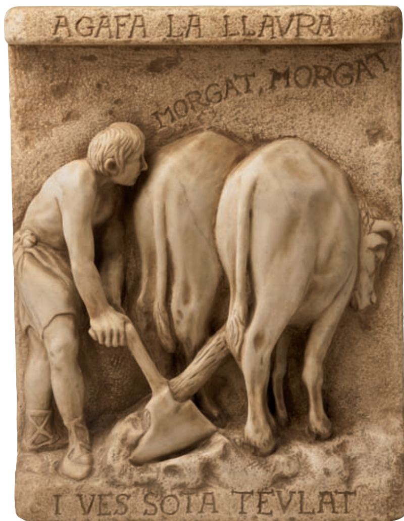
250.000 anni fa - Banyoles (Girona)