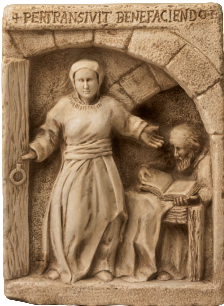
Anno 304 d.C.- Al Carrer de les Mosques 1, Girona.