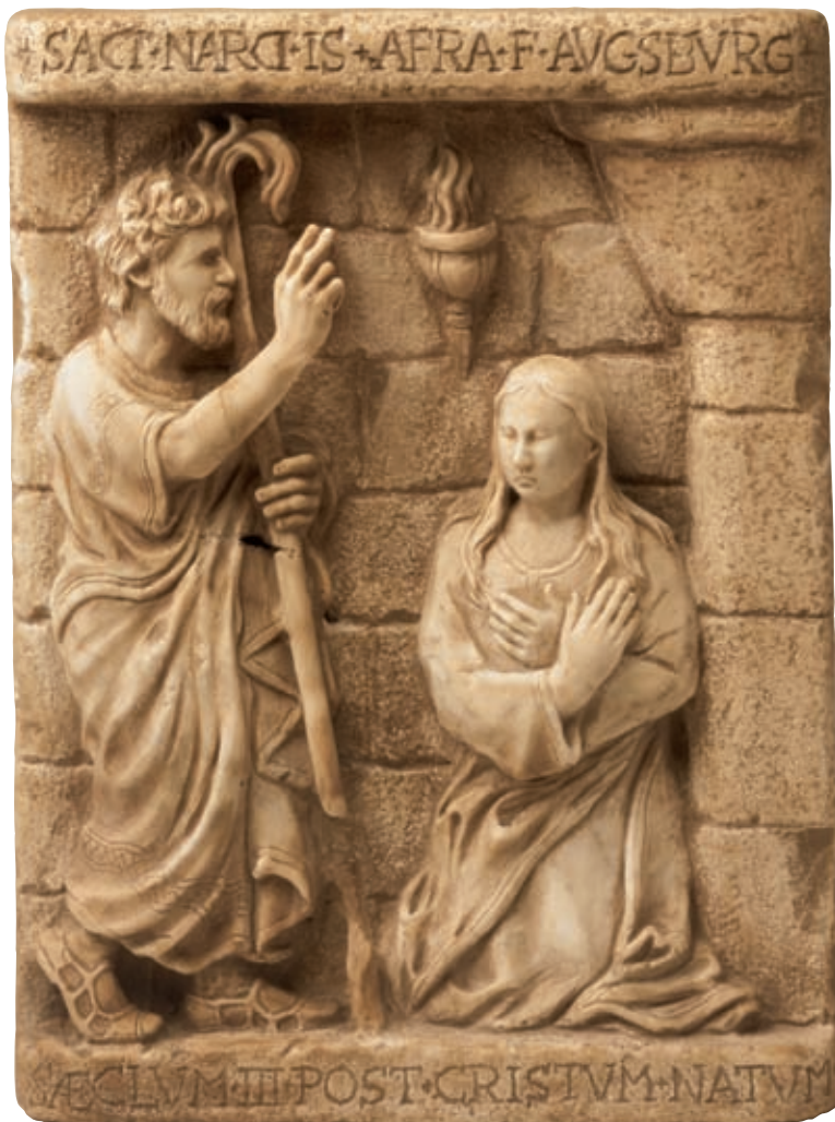
Anno 304 d.C. – Augusta (Àugsburg), Germania.