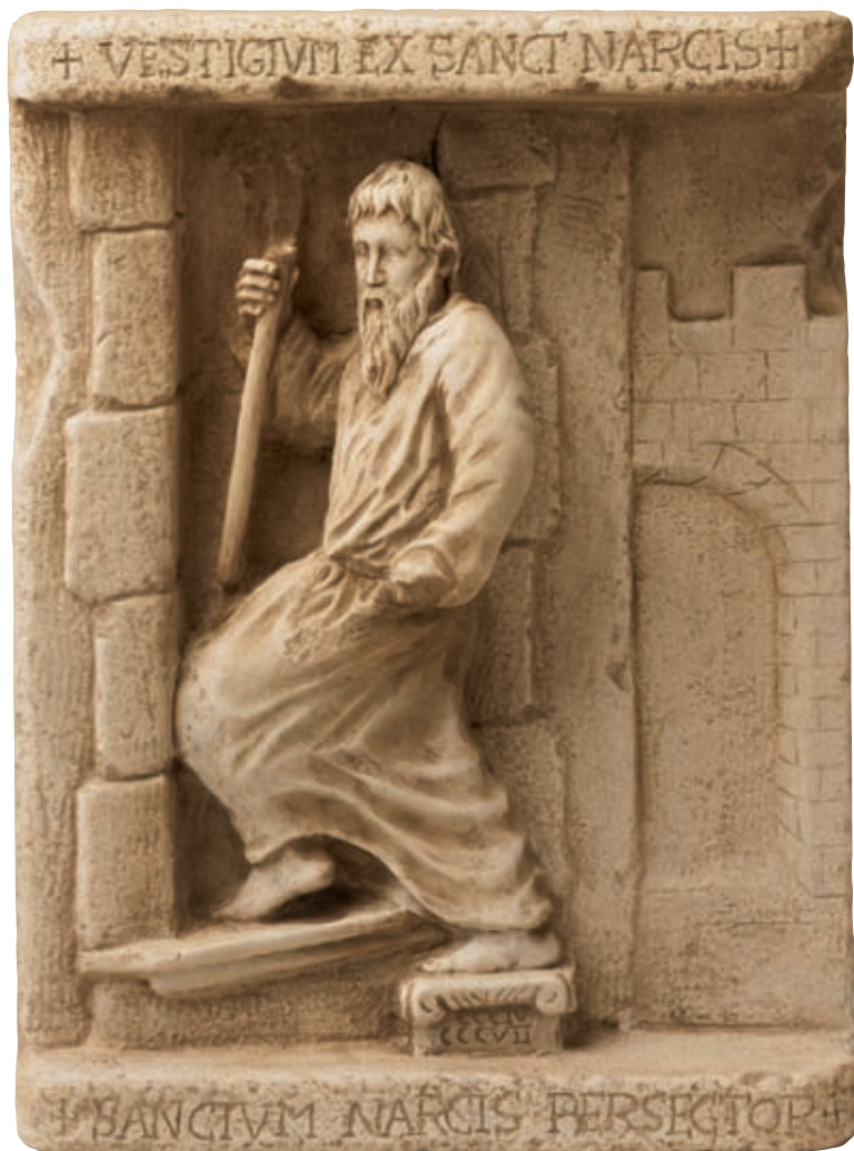
Anno 305 d.C. - Carrer de les Mosques 1, Girona.