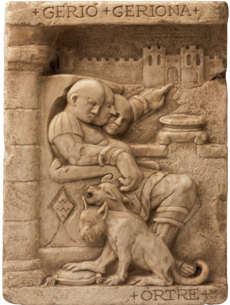
Anno 2220 a.C. - Girona.